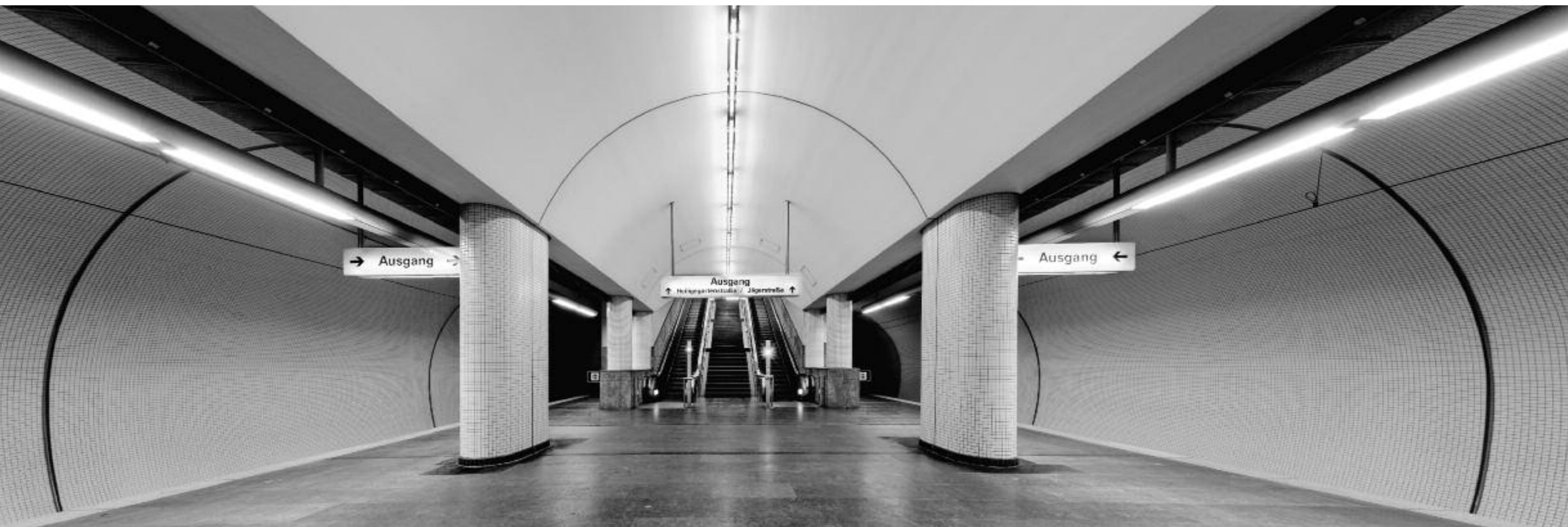
Dortmund, Haltestelle Brügmannplatz

samen Aspekt der Aufnahmen beschreibt – die Aufnahmen sind im wahrsten Sinne des Wortes im Untergrund entstanden. Angesprochen auf das Thema, denken die meisten Befragten an die allmorgendliche Rush Hour, an drangvolle Enge in überfüllten Zügen, an eine Atmosphäre hektischer Betriebsamkeit. In einem fotografischen Kontext werden die meisten Befragten an das Thema Street Photography denken – an die Bilder der letzten Nacht-